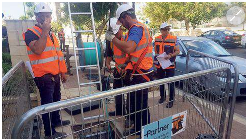
פריסת סיבים אופטיים

התקנת תשתית סיבים במבנים קיימים מהווה חסם משמעותי לשרדוג תשתיות התקשורת שכן היא כרוכה בעלויות משמעותיות ומטרד גדול לדיירים. בזכות התיקון, כל חברת תקשורת הפורסת סיבים למבנה חדש תוכל להתחבר לתשתית הסיבים הקיימת בבניין באופן מהיר וזול, ולא תידרש כל עבודת התקנה בבניין או בדירת המגורים.