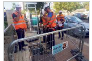
פריסת סיבים אופטיים

אביאור אבו, כלכליסט פורסם: 31.03.20, 21:48