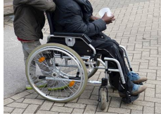
משגע את הרשת: המחשבון שמגלה את זכויות הביטוח הלאומי