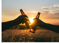
לקראת פורים: חנות האלכוהול היוקרתית תשלח לכם את היין לבית