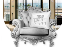
בני חורין • ביקוש רב למלון החרדי המחודש לחג הפסח