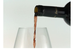
זוהי סדרת היינות המובחרת לקראת חג הפורים

בצל האיום שהפנו חסידי הרב ברלנד נגד מפלגת אגודת ישראל, באמצעות הקריאה עליה חתומים רבני שובו בנים שלא להשתתף הפעם בבחירות לכנסת, שפורסם לראשונה ב'בחדרי חרדים', כשבמקביל מתפרסם מטעם שובו בנים כי מספר הקולות המוערך של אנשי הקהילה עומד לדבריהם על למעלה מ-10,000 קולות, כך שאי ההצבעה של חסידי הרב ברלנד תסכן את כניסתו של המנדט השמיני של אגודת ישראל לכנסת ואת המנדט התשיעי של ש"ס – 'בחדרי חרדים' חושף הקלטה, בה נשמעים בכירי מקורביו של הרב ברלנד בשיחה סגורה עם הרב ברלנד עצמו, כשהם קובעים את מספר הקולות האמיתי של קהילת שובו בנים במעוז המרכזי והגדול ביותר שלהם: העיר ירושלים כולה, מונה בס"ה בין 500 ל-1000 קול בלבד.