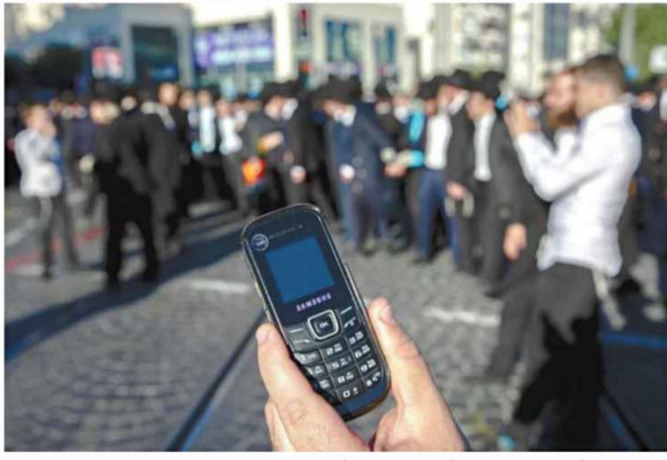
חרדים עם טלפונים כשרים. פועלים במנגנון המלשינות פייסטי (למצולמים אין קשר לכתבה)